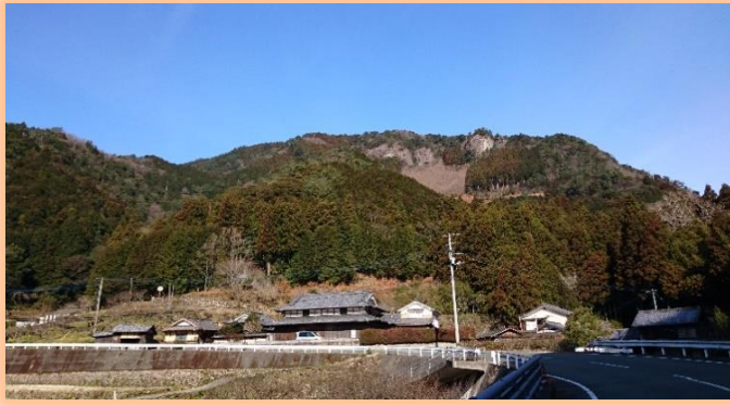
石畳古橋地区から望む黒山城跡

勝ち残った城と城主好武の器量にあやかり、 合格、成功、成就 を本丸跡で祈願しよう！