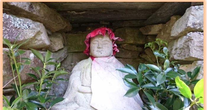
仏峠に鎮座される仏様